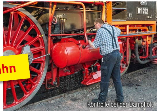
Kontrolle bei der Dampflok