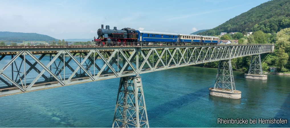
Rheinbrücke bei Hemishofen