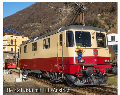
Re 421 393 mit TEE-Anstrich

Die Durchführung der Reise erfordert eine Mindestteilnehmerzahl. Routen und Traktionsänderungen aus betrieblichen Gründen sind nicht wahrscheinlich, bleiben aber vorbehalten. Es gelten die allgemeinen Reisebedingungen der ZRT Bahnreisen AG.