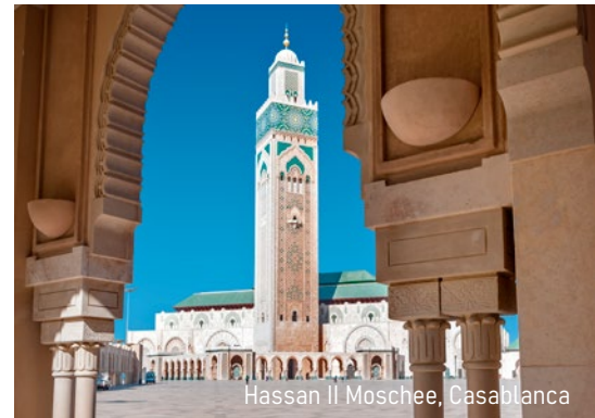
Hassan II Moschee, Casablanca