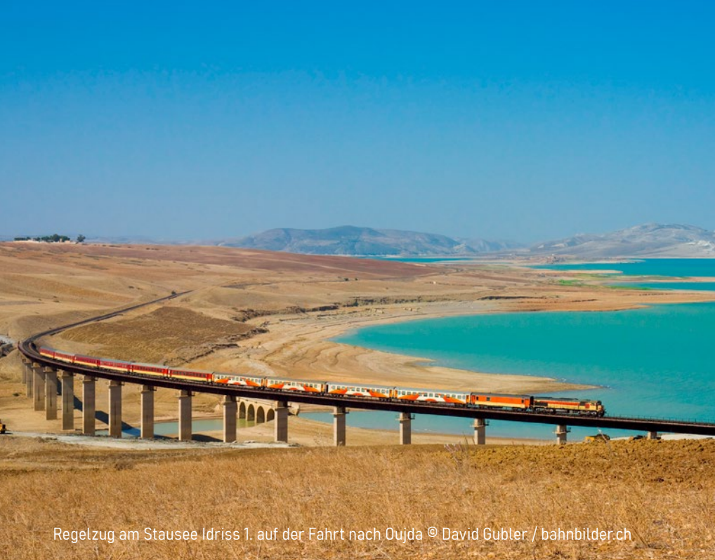
Regelzug am Stausee Idriss 1. auf der Fahrt nach Oujda