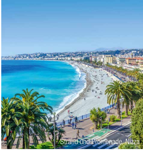
Strand und Promenade, Nizza