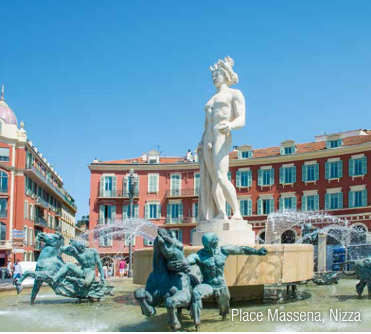
Place Massena, Nizza