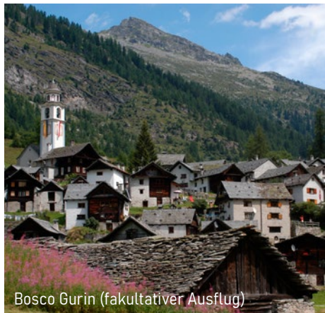
Bosco Gurin (fakultativer Ausflug)