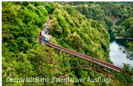
Centovalli Bahn (fakultativer Ausflug)

Im Jahr 2016 gänzlich renoviertes, modernes Hotel im Zentrum von Locarno, nur wenige Meter von der Piazza Grande entfernt und wenige Minuten vom Bahnhof. Kurzer Spaziergang durch benachbarten Park führt direkt zur schönen Seepromenade.