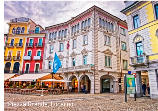
Piazza Grande, Locarno