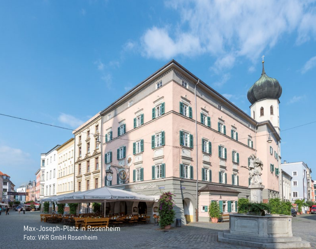
Max-Joseph-Platz in Rosenheim