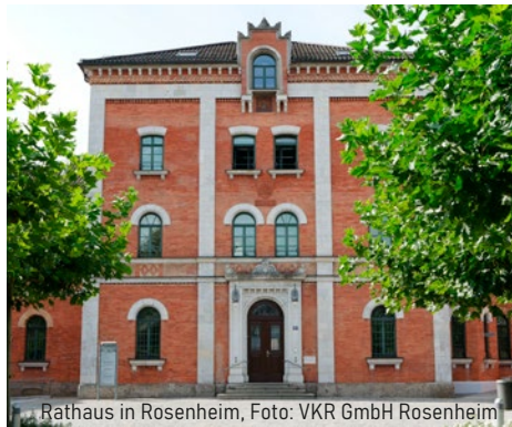
Rathaus in Rosenheim