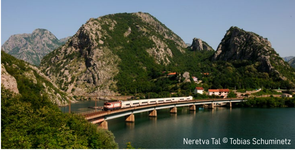
Neretva Tal