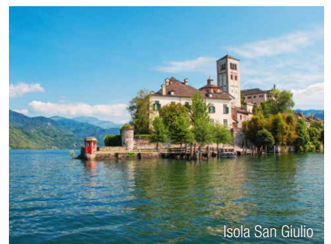
Isola San Giulio